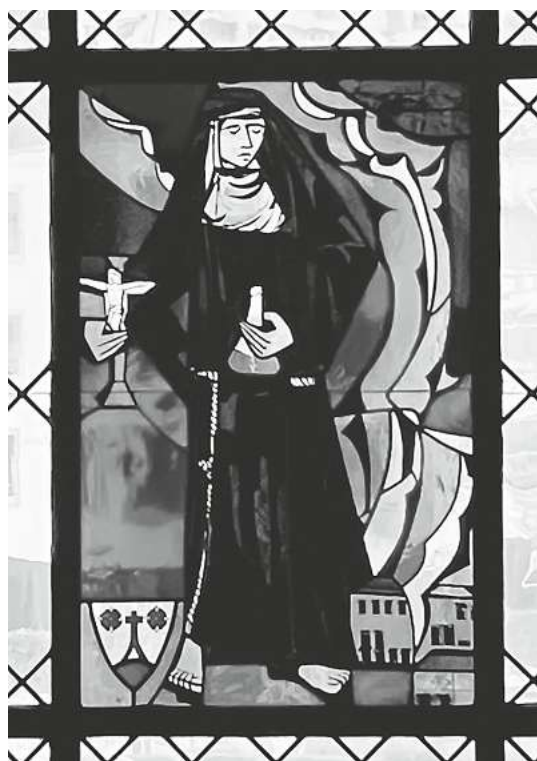
Maria Bernarda Bütler

Alle Kirchenfenster von Menznau stellen heilige oder heiligmässige Personen dar, die in der Schweiz lebten oder einen Bezug zur Schweiz hatten. Die Bilder entstanden 1942. Die hintersten beiden wurden erst bei der letzten Renovation 1987 hergestellt. Diese werden hier vorgestellt: