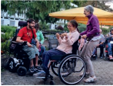
Spontaner Tanz in der Ferien- und Besinnungswoche.