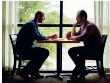
Wie kann man Männer für spirituelle Angebote ansprechen?

Di, 10.6., 13.45–19.30, Zwinglistrasse 22, Jona SG (zu Fuss 10 Minuten ab Bahnhof) | Kosten: Fr. 60.– | Anmeldung bis 25.5. an info@pef-sg.ch | pef-sg.ch/fachberatung-und-weiterbildung