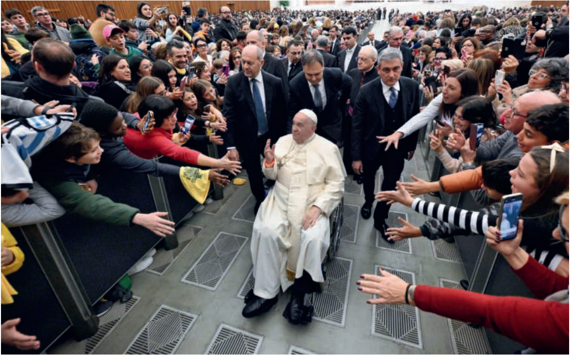
Nahbar und humorvoll, so zeigt sich Papst Franziskus in seiner Autobiografie «Hoffe».