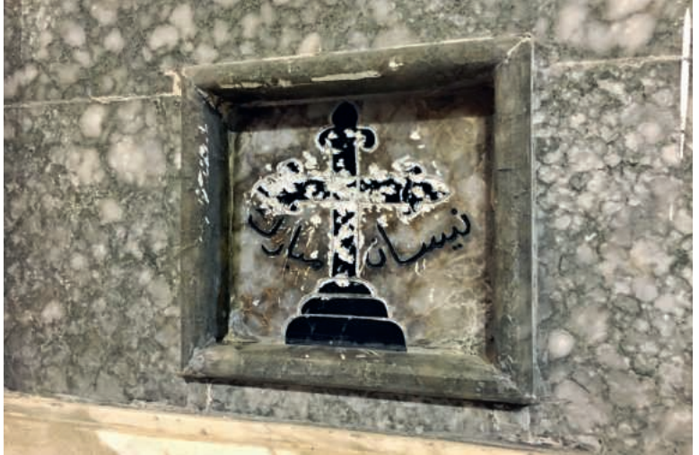
Verwüstungen an einer Kirche im Irak.