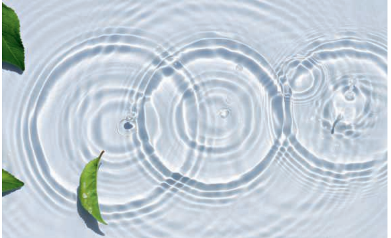
Kirchgemeinden in den Pastoralräumen: Kreisen auf dem Wasser gleich überschneiden sie sich teilweise in ihren Strukturen und Aufgaben.

Markus Riedweg von der HSS Unternehmensberatung in Sursee hat viele der umgesetzten und geplanten Fusionsprojekte von Luzerner Kirchge-