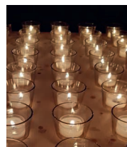
Wärme und Geborgenheit.